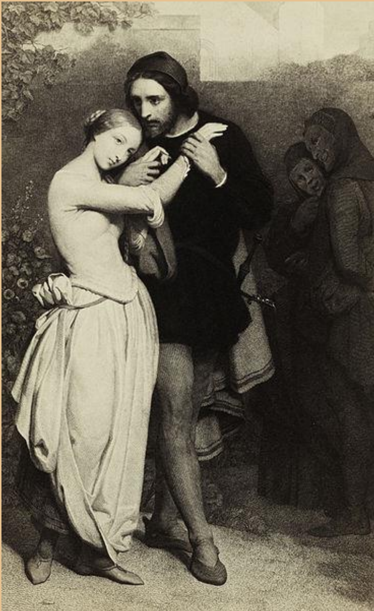
Szene aus der Oper „Faust“