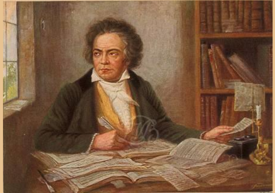
Beethoven bei der Arbeit