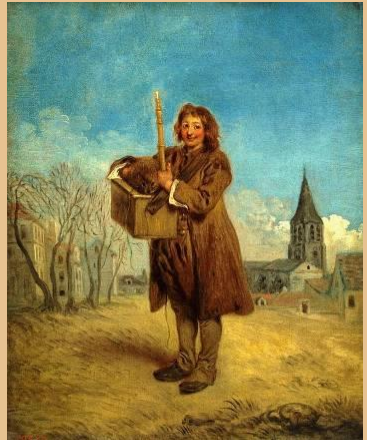
Savoyard mit einem Marmeltier von Jean-Antoine Watteau

Beethovens „Marmotte“ (Noten) Vertonung des Gedichts von Goethe