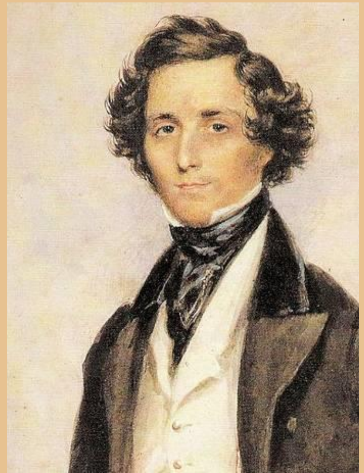
Jakob Ludwig Felix Mendelssohn Bartholdy (* 3. Februar 1809 in Hamburg; - † 4. November 1847 in Leipzig) - deutscher Komponist, Pianist, Organist und Dirigent