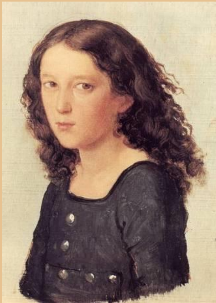
Der 12-jährige Mendelssohn